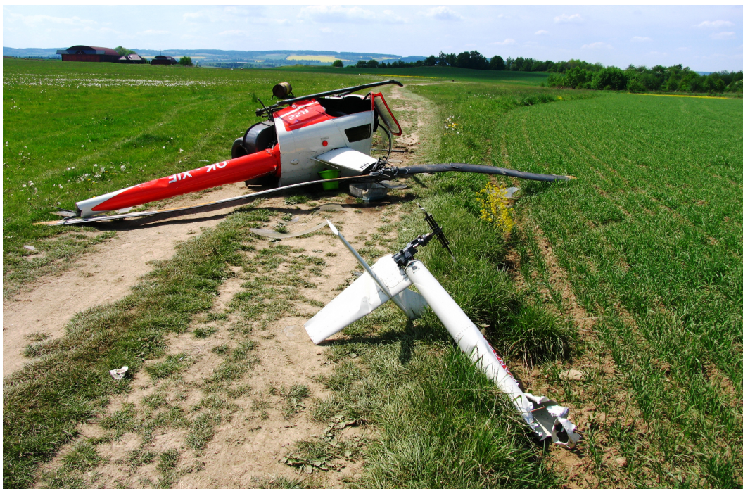
Obr. 1 Místo letecké nehody vrtulníku OK-XIF

Svědék – instruktor, který byl na ploše letiště, měl vrtulník v dohledu a udržoval s pilotem-žákem během letů spojení pomocí radiostanice. Po převrácení vrtulníku pilot-žák rozepnul bezpečnostní pás a chtěl opustit kabinu. V té době již doběhl k převrácenému vrtulníku instruktor spolu s dalšími osobami a pomohli mu opustit vrtulník. Poté instruktor v kabině vypnul spínače a vyndal palubní dokumentaci.